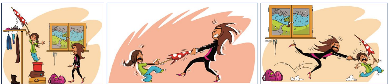
Beispiel eines eskalierenden Geschwisterstreits: Wem gehört der Schirm?

Gerne können Sie diese Ausschreibung an Interessierte weiterleiten.